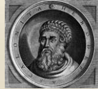
(聖光神學院聖經地理資訊網)