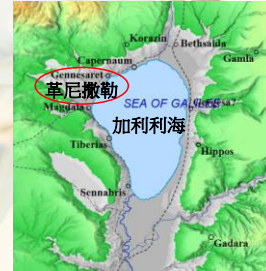
(Bible Mapper 5.0)