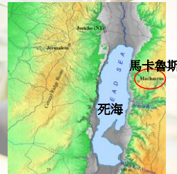
(Bible Mapper 5.0)