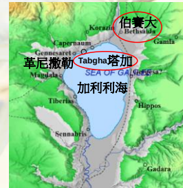
(Bible Mapper 5.0)