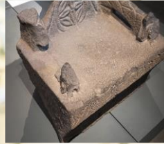
耶拉瓦 (Chorazin) 所發現的主後第三世紀猶太會堂遺留的“摩西的位”