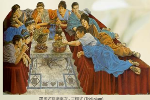
羅馬式筵席擺法 - 三欄式 (Triclinium) http://tweedandthegentlemansclub.blogspot.com/2011/09/triclinium-roman-dining-room.html