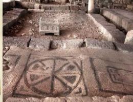
第一世紀猶太會堂