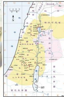
(聖光神學院聖經地理資訊網)