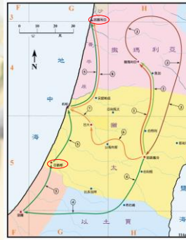
(聖光神學院聖經地理資訊網)