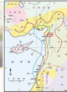
(聖光神學院聖經地理資訊網)

6/2022 版權所有 Copyright © 2022 by 劉展華 Chan-Hua (Jeff) Liu