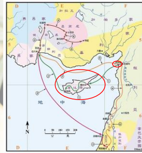
(聖光神學院聖經地理資訊網)