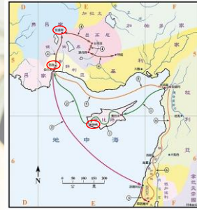
(聖光神學院聖經地理資訊網)