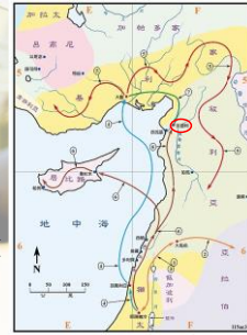
(聖光神學院聖經地理資訊網)