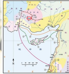
(聖光神學院聖經地理資訊網)