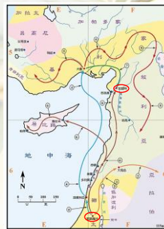
(聖光神學院聖經地理資訊網)