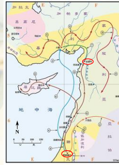
(聖光神學院聖經地理資訊網)