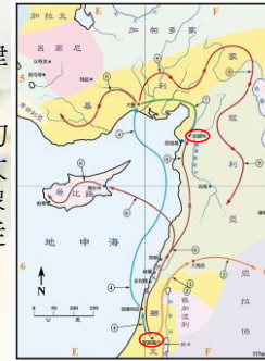
(聖光神學院聖經地理資訊網)