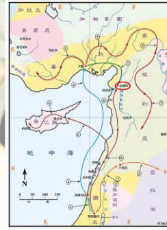
(聖光神學院聖經地理資訊網)