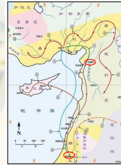
(聖光神學院聖經地理資訊網) 5