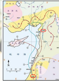
(聖光神學院聖經地理資訊網)