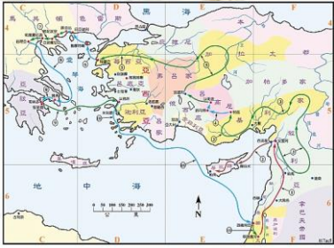
(聖光神學院聖經地理資訊網)