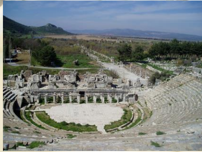
以弗所的半圓形露天劇院