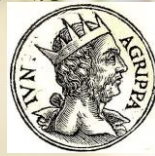
希律亞基帕二世 Herod Agrippa II