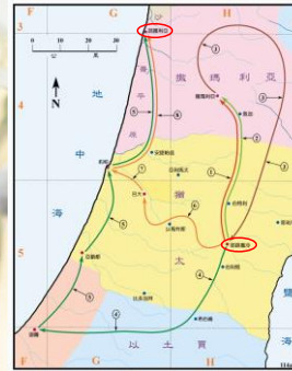
(聖光神學院聖經地理資訊網)